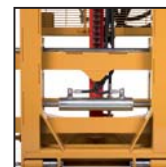
Traslatore laterale Side shift