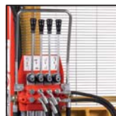
Distributore 4 leve Distributor with 4 levers