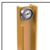
Cuscinetti radiali a rulli cilindrici Straight roller radial bearings