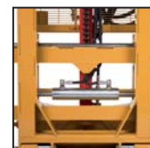
Traslatore laterale Side shift