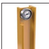
Carrello con cuscinetti radiali a rulli cilindrici Truck with radial bearings