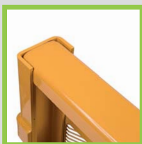
Profili in acciaio piegato Bent steel profiles