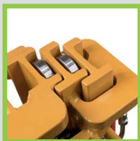
Profili in acciaio laminati a caldo Hot-rolled steel profiles