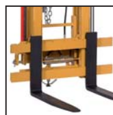
Forche FEM FEM forks