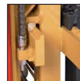
Pattini traslatore laterale FEM FEM side shift pads