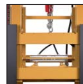
Traslatore laterale FEM FEM side shift