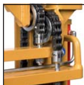
Catene di sollevamento tipo "Fleyer" "Fleyer" type lifting chains