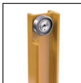
Cuscinetti radiali a rulli cilindrici Straight roller radial bearings