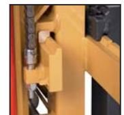
Pattini traslatore laterale FEM FEM side shift pads