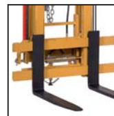
Forche FEM FEM forks