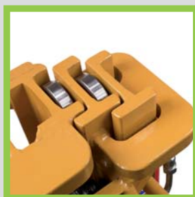
Profili in acciaio laminati a caldo Hot-rolled steel profiles