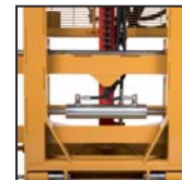
Traslatore laterale Side shift