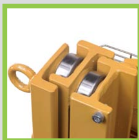
Profili in acciaio laminati a caldo Hot-rolled steel profiles