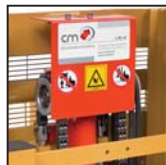
Catene di sollevamento tipo "Fleyer" "Fleyer" type lifting chains