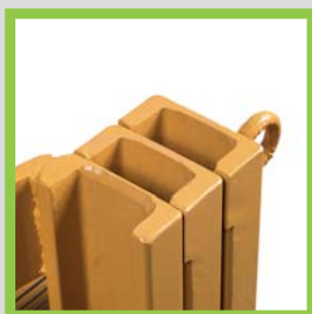
Profili in acciaio laminati a caldo Hot-rolled steel profiles