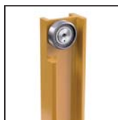
Cuscinetti radiali a rulli cilindrici Straight roller radial bearings