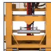
Traslatore laterale Side shift