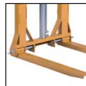
Forche pieghevoli e regolabili Adjustable and pliable forks