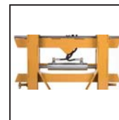
Traslatore laterale Side shift