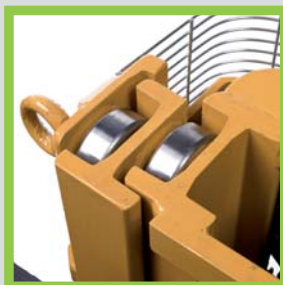
Profili in acciaio laminati a caldo Hot-rolled steel profiles