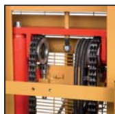
Catene di sollevamento tipo "Fleyer" "Fleyer" type lifting chains