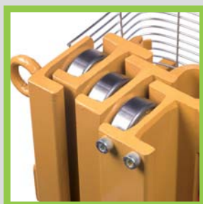
Profili in acciaio laminati a caldo Hot-rolled steel profiles