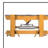
Traslatore laterale Side shift