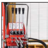
Distributore 4 leve Distributor with 4 levers