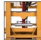
Traslatore laterale Side shift