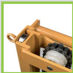
Profili in acciaio laminati a caldo Hot-rolled steel profiles