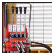
Distributore 4 leve Distributor with 4 levers