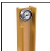
Cuscinetti radiali a rulli cilindrici Straight roller radial bearings