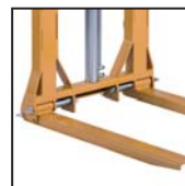
Forche pieghevoli e regolabili Adjustable and pliable forks