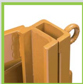
Profili in acciaio laminati a caldo Hot-rolled steel profiles