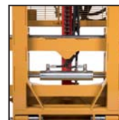
Traslatore laterale Side shift