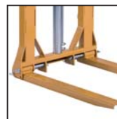
Forche pieghevoli e regolabili Adjustable and pliable forks