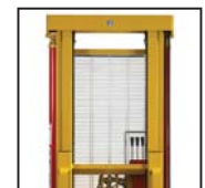
Ottima visibilità Great visibility