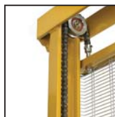
Catene di sollevamento standard Standard lifting chains