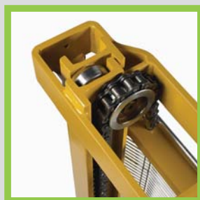
Profili in acciaio laminati a caldo Hot-rolled steel profiles