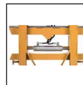
Traslatore laterale Side shift