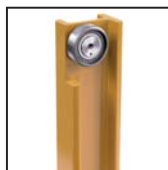
Cuscinetti radiali a rulli cilindrici Straight roller radial bearings